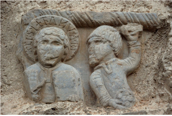
Lapidación de San Esteban

de palabras se hace mediante interpunción de tres puntos, empleados de una forma bastante arbitraria.