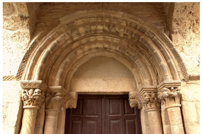
Portada de San Esteban

Algunos años después, el promotor de la fundación entregaba el templo a la sede asturicense. El 12 de agosto de 1124. Pedro Moniuz dona-