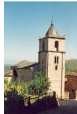
Iglesia de San Esteban. Fachada norte